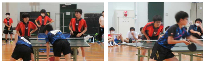
〈東中・鏡が沖との団体戦を制す！〉

男子は、県大会出場を目標としてきましたが、大会がなくなったことで、この練習試合でライバルの東中、鏡が沖中に勝つ！と目標を変えました。その目標を達成できたのは、一人一人が「最後まで全力でやり遂げる・仲間と協力する」を大切に精一杯頑張ったからだと思います。後輩は、この良い雰囲気や伝統としてほしいです。