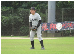
〈一中・松浜中・南中の合同チームで参加〉