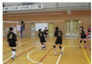
〈新人大会ベスト4でのリーグ戦〉