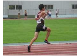
〈100m走、4×100mリレーでの3年生の力走!〉